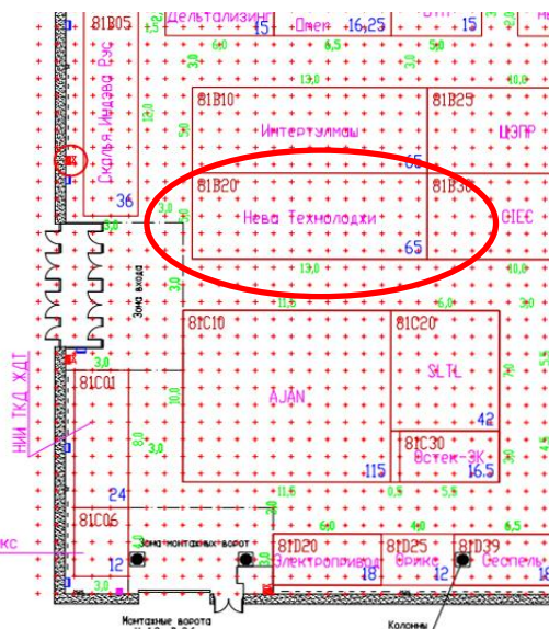
Стенд компании 81B20

Стенд "Нева Технолоджи" очень легко найти: Павильон 8 зал 1, прямо около входа в павильон